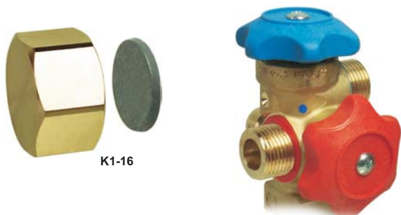
Applicazione tipica su RC92X01

Per installazione sulle Valvole delle bombole di refrigerante in Acciaio e/o Alluminio con capacità >10 Kg.