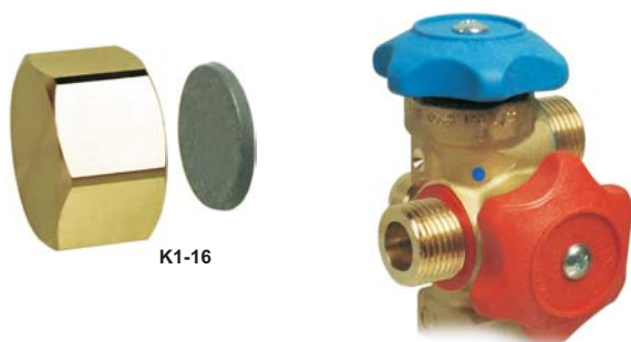
Applicazione tipica su RC92X01

Per installazione sulle Valvole delle bombole di refrigerante in Acciaio e/o Alluminio con capacità >10 Kg.