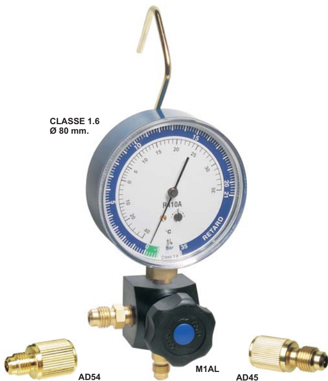
CLASSE 1.6 Ø 80 mm.

M1HCL Ø 63 mm. Cl. 1.6 °C/Bar per R-290 e R-600.