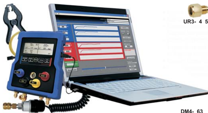
UR3- 4 5